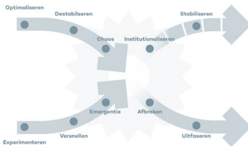
Figuur 1. De X-curve van transitie.

Een transitie vraagt meer dan een route en beweging. Daarvoor tekent de hoogleraar een tweede model, met vier kwadranten (zie Figuur 2). Elk vlak staat voor een strategie die je kunt kiezen om te transformeren: je kunt werken vanuit wet- en regelgeving, vanuit doelmatig management, door in netwerken mee te bewegen met partnerorganisaties of door aan te sluiten bij de maatschappelijke beweging die er al is.